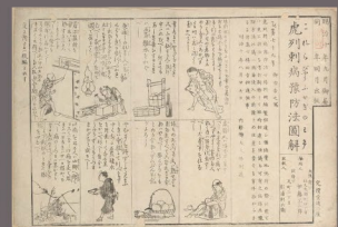
(左) 「はしかまじないおしえ宝」