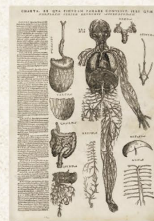
De humani corporis fabrica(野間文庫)