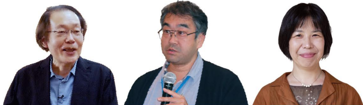
井上章一 日文研所長

安井教授を聞き手に、井上所長と関野教授が、「アナログとデジタル」の今、そしてこれからのテーマにお話します。それぞれの方法は、これからの時代にどのようにアプローチしあい、相乗効果を生み出していくのでしょうか。