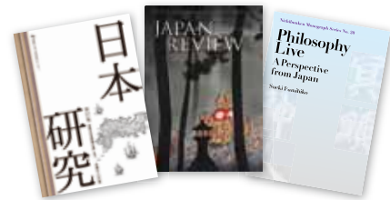
最近の日文研出版物