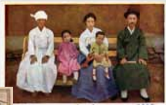
（朝鮮風俗）家庭

日本研究に必要な各種資料を幅広く収集し（図書資料約54万冊）、国内外の研究者の利用に供するとともに、様々な情報を提供しています。利用者は図書を自由に手にとって閲覧することができます。外部の方でも、学術研究・調査等を目的とする場合であれば、事前申請のうえ閲覧が可能です。