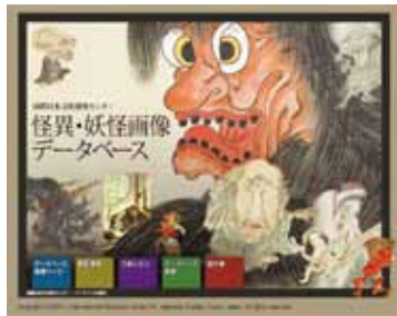
データベースの一例