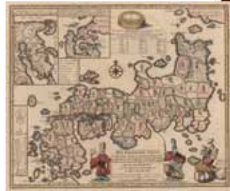
Het koninkryk Japan （1735年版の西洋古版日本地図）