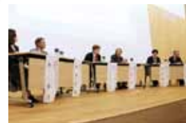
日文研特別公開シンポジウム