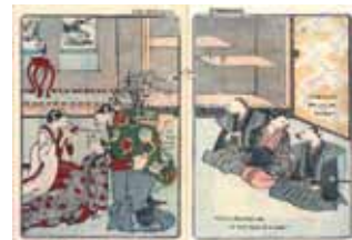
Nedzumi no Yome-Iri (ちりめん本より)

日本研究に必要な各種資料を幅広く収集し（図書資料約56万冊）、国内外の研究者の利用に供するとともに、様々な情報を提供しています。利用者は図書を自由に手にとって閲覧することができます。外部の方でも、学術研究・調査等を目的とする場合であれば、事前申請のうえ閲覧が可能です。