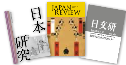
最近の日文研出版物