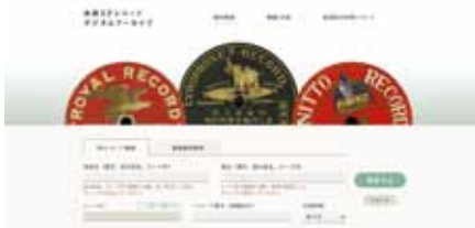
データベースの一例

日文研は、所蔵する日本研究資料、所員の研究成果をはじめ、他機関所有の日本研究資料などのデータベースを作成しており、現在42種類をウェブで公開しています。※2020年7月1日現在