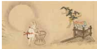
妖怪四季風俗絵巻(抜粋)