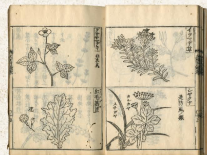
大倭本草(宗田文庫)